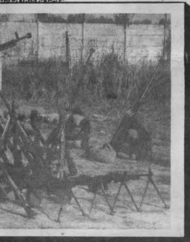
Một trong những binh sĩ Việt-Cộng bị thương được ta băng bó và chăm sóc tủ-tế.

Từ 13 đến 16 giờ mùng 3 Tết, Tiểu đoàn K. 2 và K. 3 thuộc Trung đoàn Đồng Nai đã tháo chạy bỏ lại xác đồng đội và vũ khí. Quân ta hoàn toàn làm chủ tình hình, thu dọn chiến trường. Tổng kết chiến thắng tại Tỉnh lỵ ngày mùng 3 Tết :